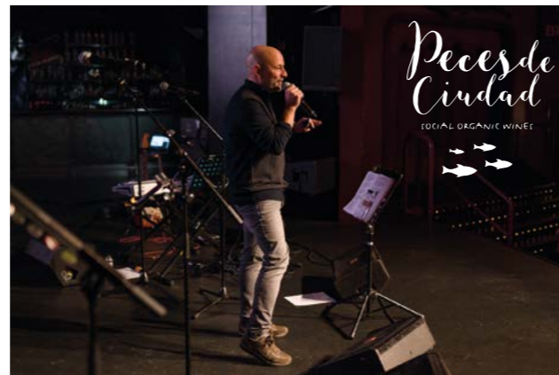
Assistència concert d'entrega de donatius "Peces de Ciudad".