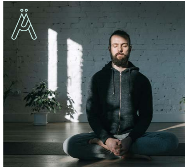
Nou projecte: Taller de Meditació.