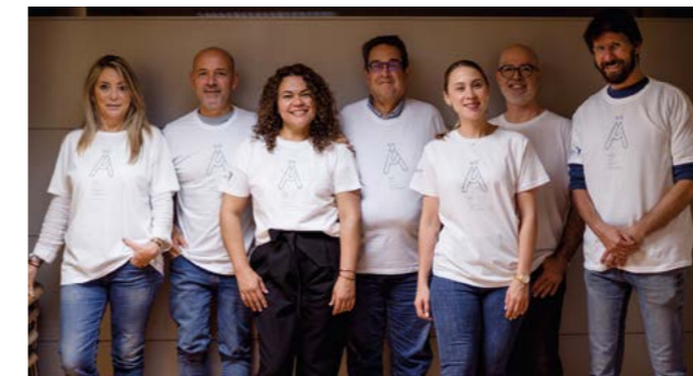
Formacions bàsiques de voluntariat SiC.

Jornada en l'Hospital Vall d'Hebron: Estratègia de participació de pacients i professionals del campus.