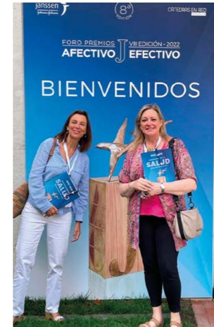
Fòrum "Premios Afectivo Efectivo 2022" organitzat per Janssen a Madrid.