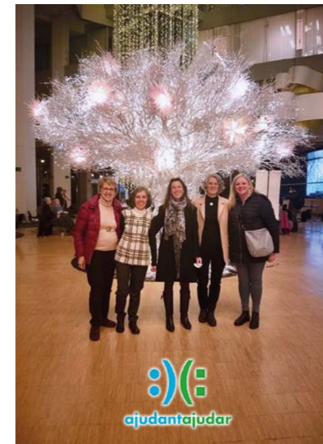
Reunió de coordinació SiC.