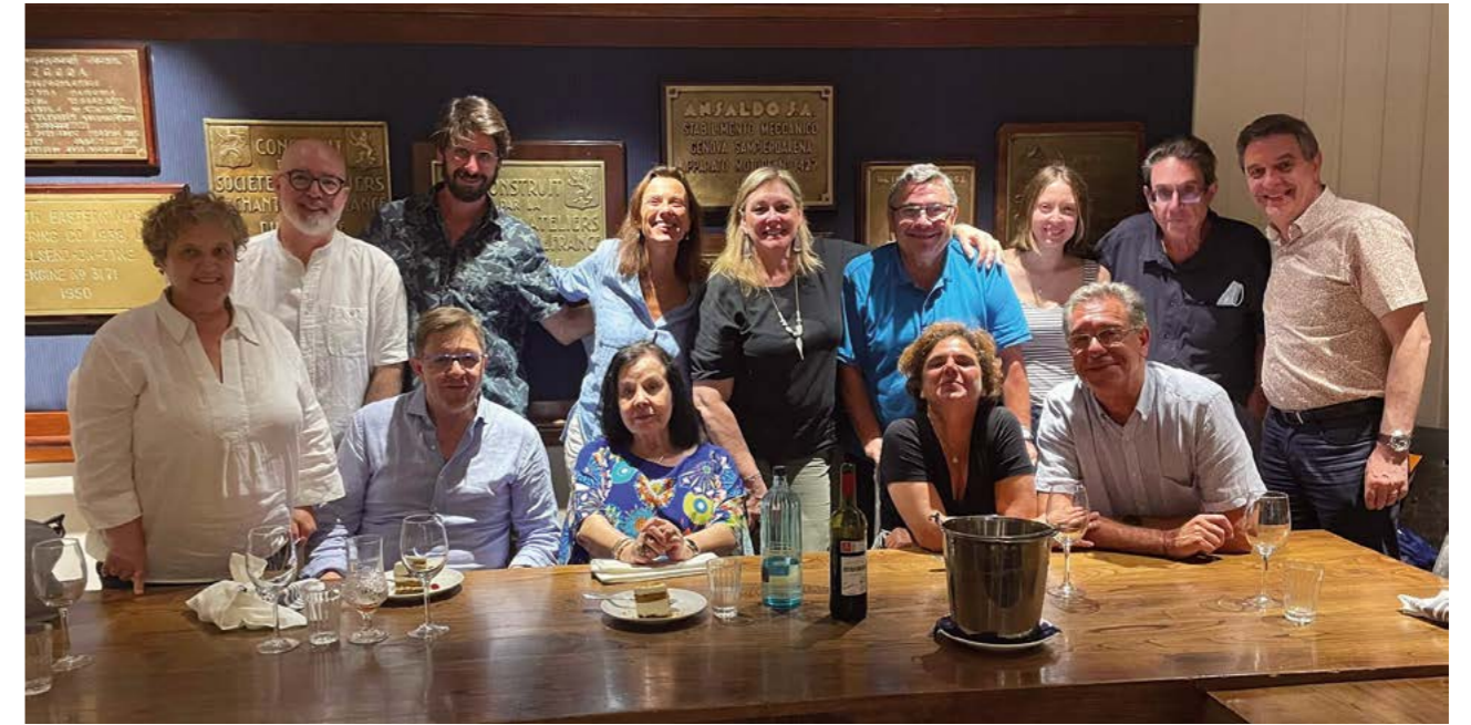
Sopar de voluntaris SiC