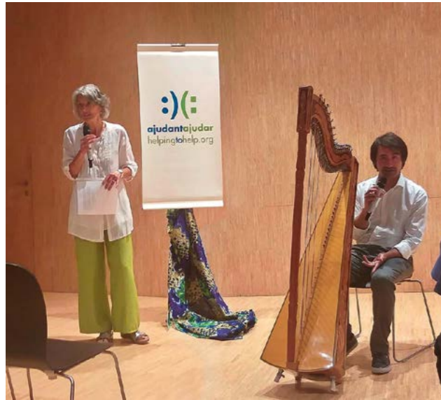
Assistència al concert de primavera de la Fundació Ajudant Ajudar.