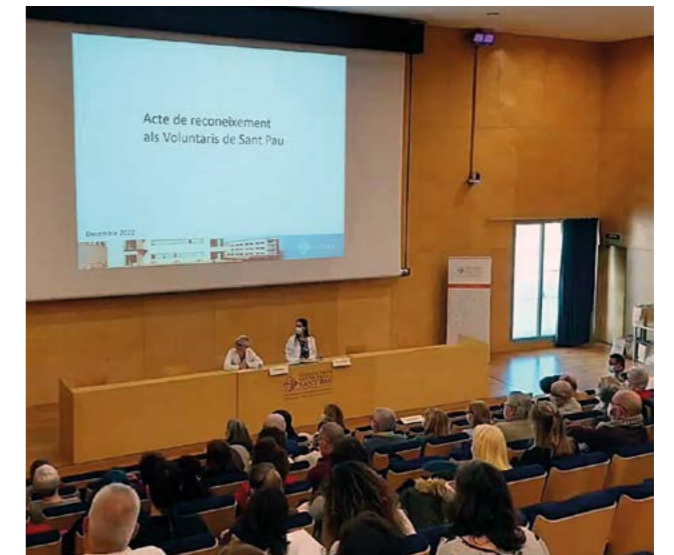
Assistència a l'acte de reconeixement als voluntaris, Hospital de Sant Pau.